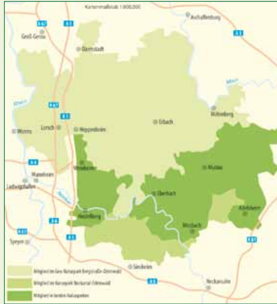
Übersichtskarte der Naturpark-Gebiete

Sie können die Wanderkarten telefonisch oder direkt über die Geschäftsstellen der beiden Naturparke bzw. die Shops auf den Homepages bestellen oder über den Buchhandel beziehen. Eine regionale Auswahl halten die jeweiligen Infozentren, Eingangstore, Umweltpädagogischen Stationen sowie die Städte und Gemeinden vor Ort für Sie bereit.