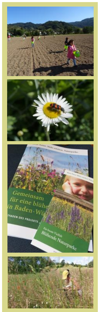
Neue Wildblumenwiesen (m 2 ) im Projekt "Blühende Naturparke" (2018/19)

Rund 130 Teilnehmer haben Mitte November bei unserer Tagung in Bühlertal teilgenommen. Vorträge zum Artenschutz, Projektvorstellungen und die Arbeit in Kleingruppen haben den Tag geprägt. Die Vernetzung zwischen Akteuren im Bereich des Insektenschutzes spielte eine besondere Rolle.